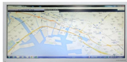
動態管理システム